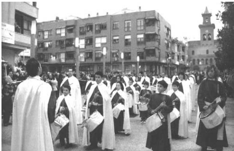
Banda de la Cofradía de la Hermandad de la Santa Vera Cruz.