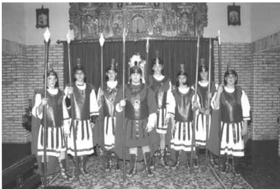
Guardia Romana año 2006