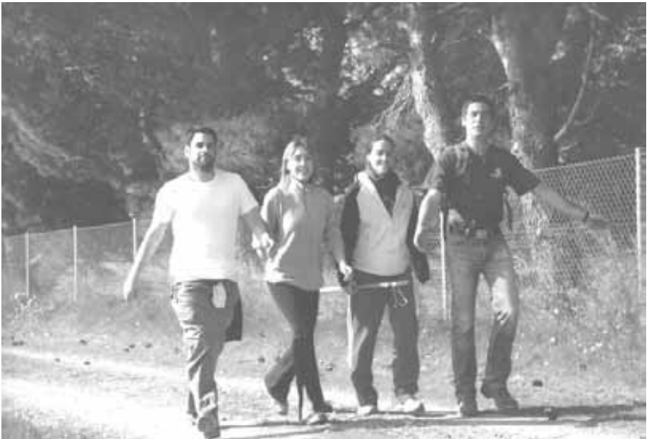
Alegría en el camino