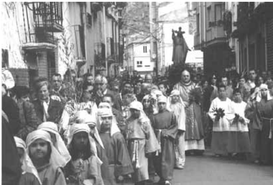
Procesión año 2006

Se darán tres tandas a la vez: Padres, adolescentes y niños.