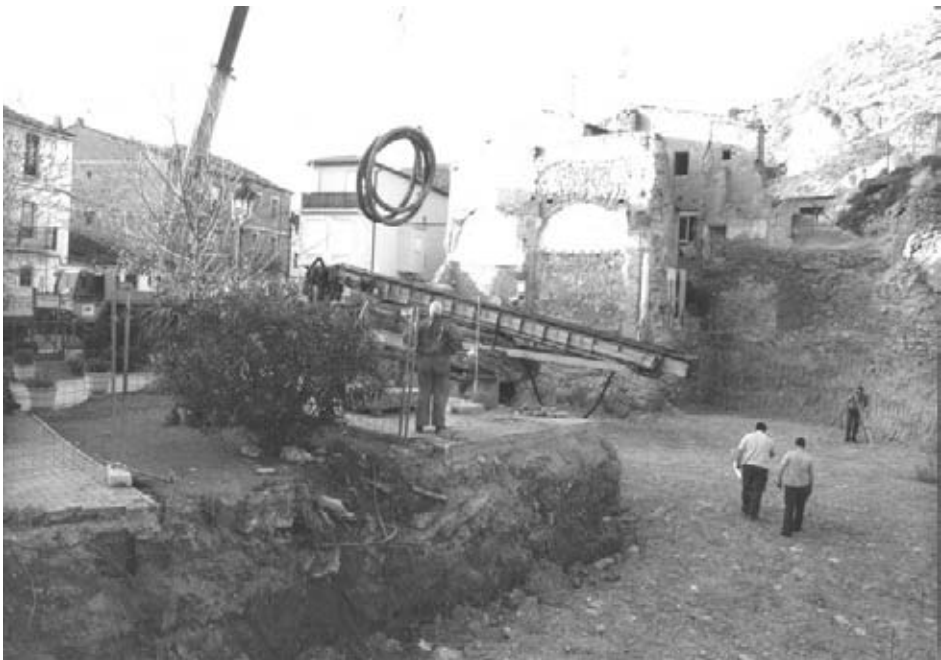
Colocación de los pilotes de cimentación de la Basílica.

Este es nuestro vivo deseo y la mejor flor que podemos ofrecer a nuestra Madre la Virgen del Olmo.