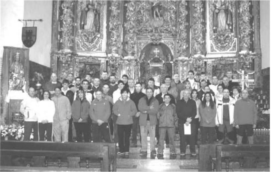
Participantes en la Javierada del 2009 desde Azagra.