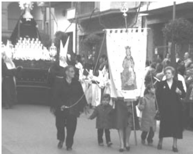
Virgen del Olmo Madre Dolorosa.