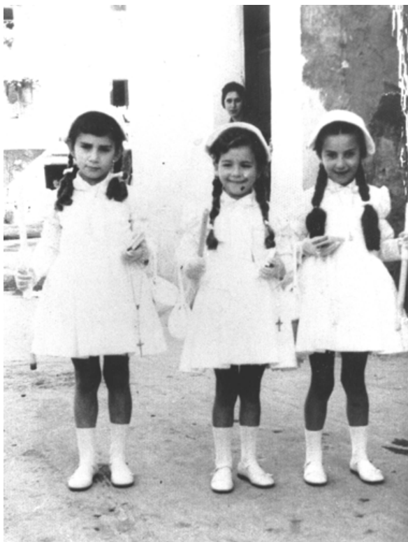
Niñas de Comunión 22 de Mayo de 1960

A las 12,00 de la mañana, Primeras Comuniones de los niños y niñas de Azagra.