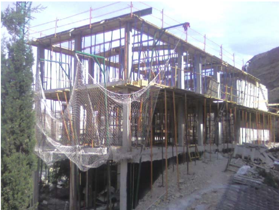
Estado de la obra de la nueva Basílica el 1 de Junio del 2010