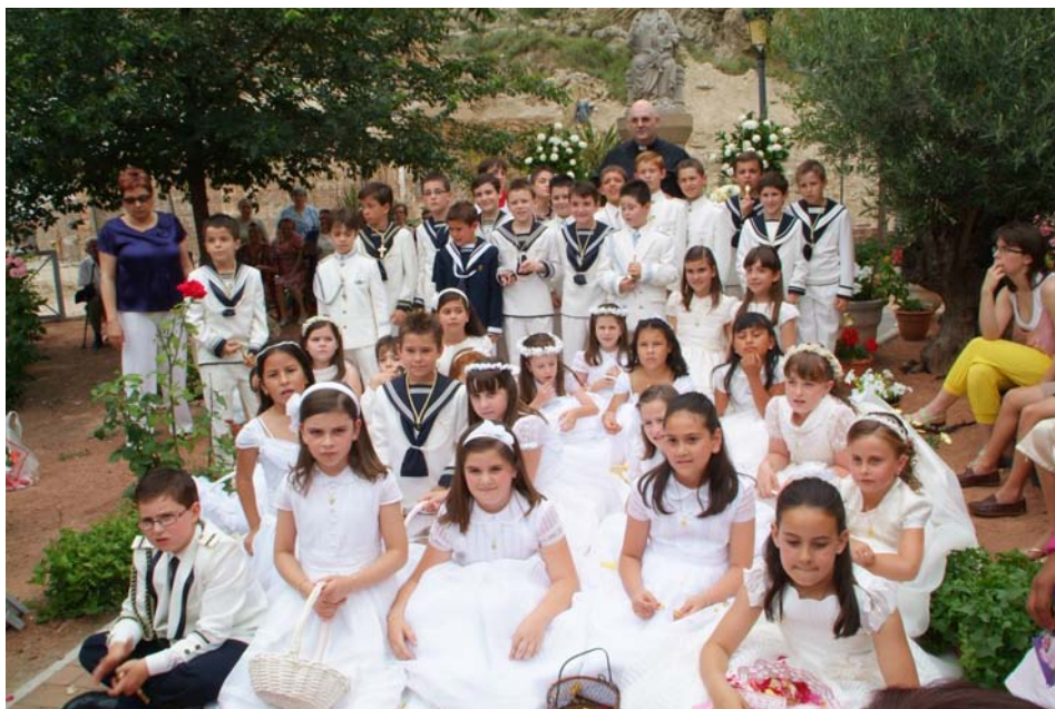
Niños de Primera Comunión el día del Corpus Christi del 2009

Todos los días del mes tendremos nuestro recuerdo al Sagrado Corazón de Jesús. Revivamos con fe y alegría estas fiestas de junio que tanto arraigo tuvieron en nuestra parroquia.