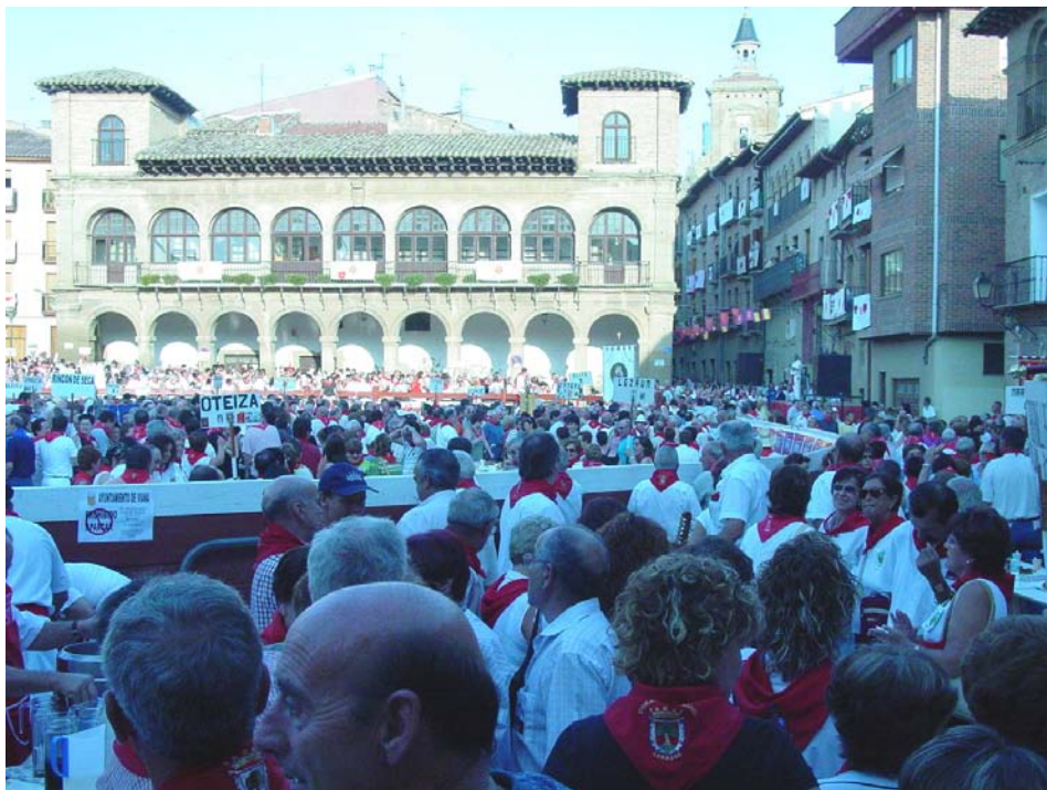
Concentración de Auroros de 2007 en Viana

Los interesados, pueden comunicarlo a cualquier miembro del Grupo y le informaremos oportunamente.