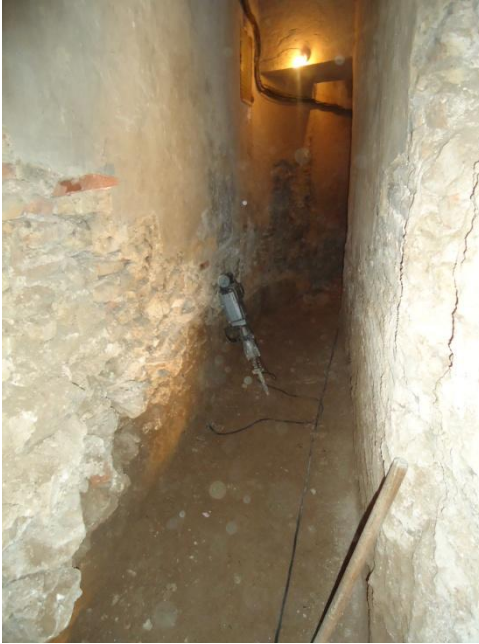
Pasillo trasero... Antes.