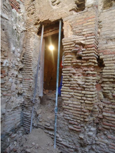
Salida al patio posterior... Antes.