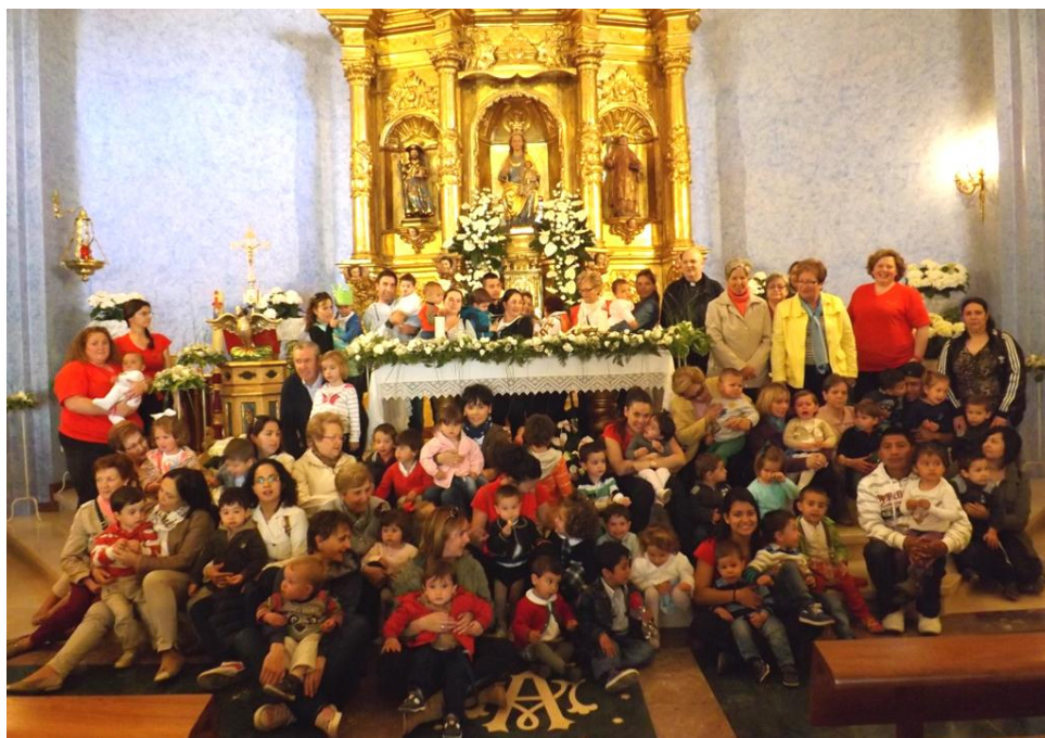
Niños Primera Comuni3n